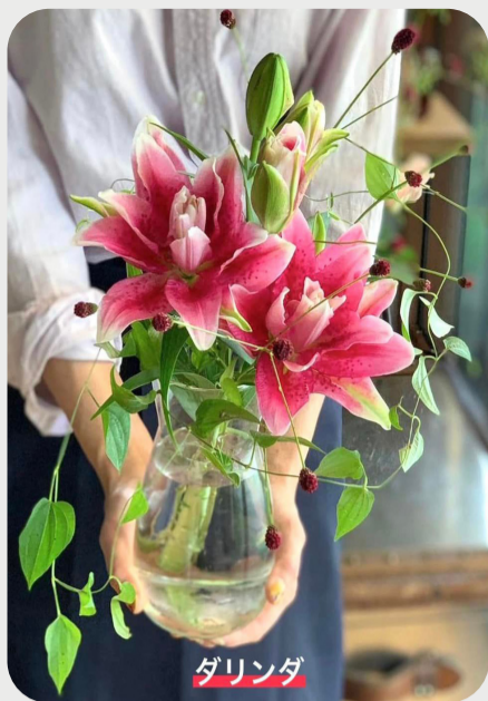
9/13 #lovelilyambassador 鳴床卓士 猛暑でも日持ち面で優れるユリ。八重も 様々な品種が出ており是非お気に入りの 1つを見つけてください。短くたって使 い道は無限大！ 品種名：ローズリリー・ダリンダ