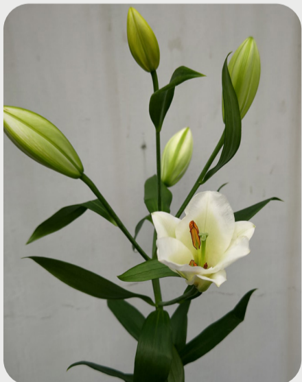
9/28 #lovelilyambassador 辻沙和子 様々な大きさのユリがありますが、 ちょっと小ぶりのユリは小さめな花瓶に も生けやすい。 小さいけど充分ヒロインになれる！！ 品種名：ペタカス