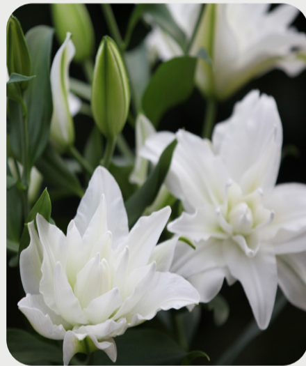
9/25 #lovelilyambassador 小池一構 過酷な暑い夏を超えて育っても凛として 上を向き、花を咲かせたその姿は力強く 何とも言えない美しさがあります。中輪 の可愛い八重ユリです。 品種名：シャルドネ