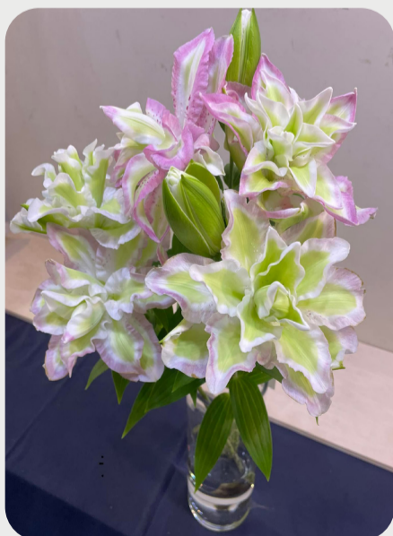
9/28 #lovelilyambassador 鈴田正二郎 時期によって色合いは変わるみたいで、 色んな時期に見てみたい百合です 名前も可愛い 品種名：ラッキーエンジェル