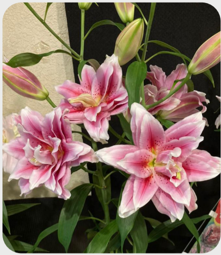
#lovelilyambassador 岸宏行 この猛暑にも負けず発色抜群のユリ。 ちょっと濃いけど鮮やかなピンクの八重。 品種：ローズリリー・シアラ