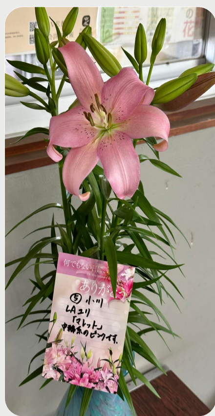
9/15 #lovelilyambassador 岡崎賢司 一重のユリも綺麗です。 品種名：マレット